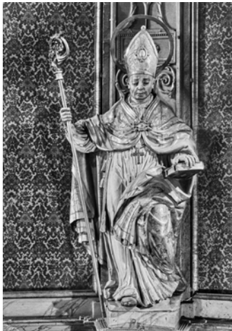
©2023 Institut Amatller d'Art Hispànic - im. IAAH_GUDIOL_A_01930 (foto Gudiol A-1930 / ante 1939)