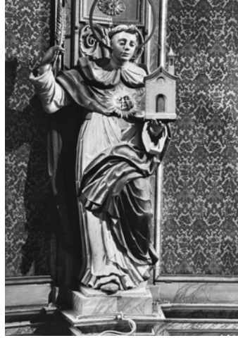
©2023 Institut Amatller d'Art Hispànic - m. IAAH_GUDIOL_A_01931 (foto Gudiol A-1931 / ante 1939)