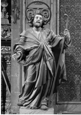
©2006 Institut Amatller d'Art Hispànic - im. 01745001 (foto Gudiol A-1932 / ante 1939)