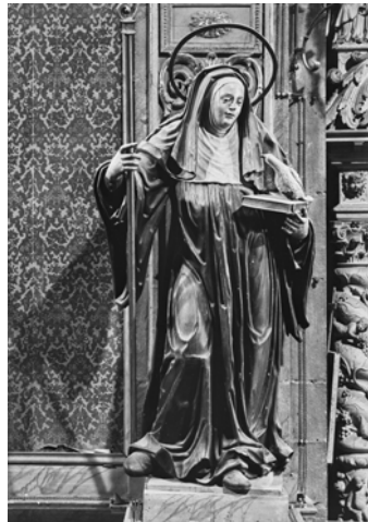
©2006 Institut Amatller d'Art Hispànic - im. IAAH_GUDIOL_A_01929 (foto Gudiol A-1929 / ante 1939)